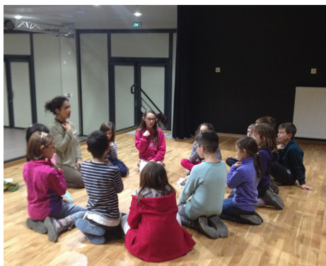
Atelier Brézins - 2017

POUR L'ANNÉE 2018, LES ATELIERS DÉBUTERONT DÈS LA RENTRÉE DE JANVIER.