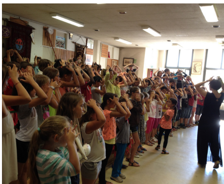
Répétition générale juillet - 2016