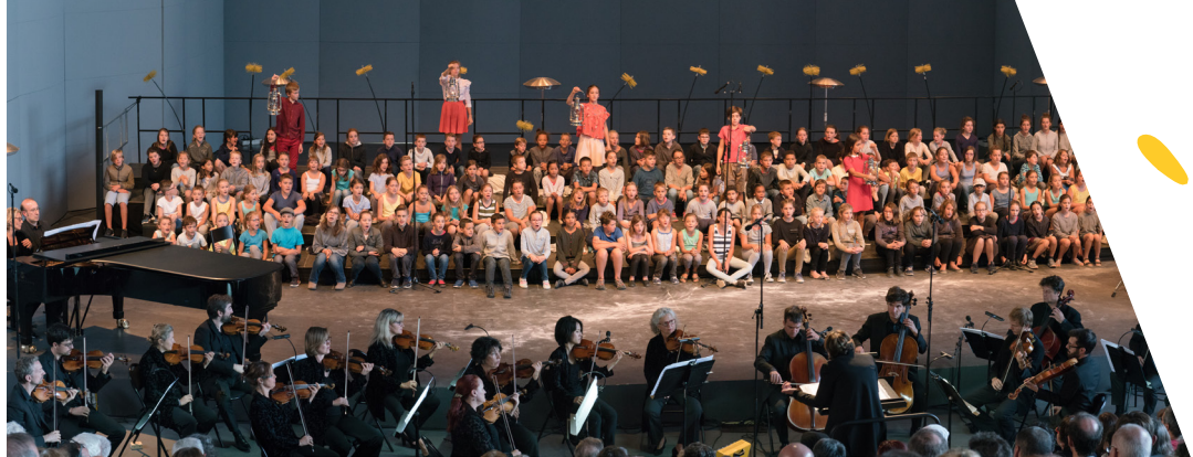
Le Concert des enfants, Château Louis XI, La Côte-Saint-André - 3 septembre 2017